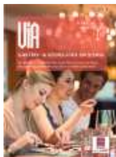
VIA Gastro- & Szeneguide Graz Tourismus