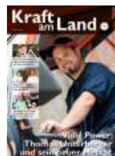
Kraft am Land Landing Weiz