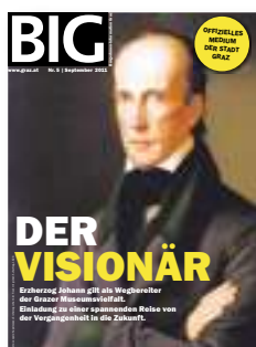
BIG Stadt Graz