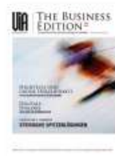
VIA International Corporate Media Service