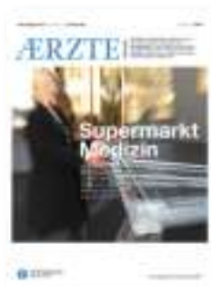
ÄRZTE Steiermark Ärztammer Steiermark