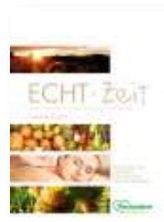
ECHT*Zeit Thermenland Steiermark