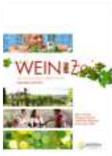
WEIN*Zeit Thermenland Steiermark