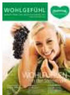
Wohlgefühl Steiermark Tourismus