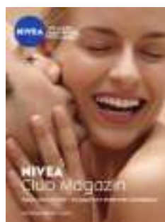
Nivea Club Magazin NIVEA Freizeit Club

A 8010 Graz, Münzgrabenstraße 84b/Messequartier T +43 (0) 316/90 75 15-0, F +43 (0) 316/90 75 15-20 office@cm-service.at, www.fresh-content.at