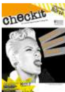
checkit Jugendmagazin Land Steiermark